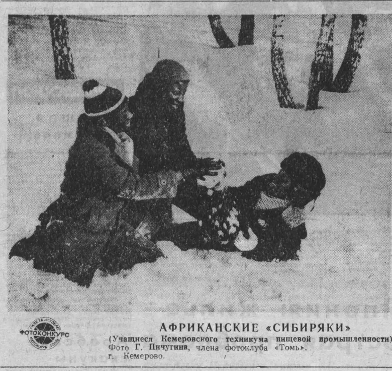
АФРИКАНСКИЕ «СИБИРЯКИ» (Учащиеся Кемеровского техникума пищевой промышленности).