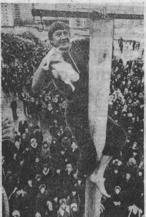
В ПРОШЕДШЕЕ воскресенье кемеровчане собрались по старому русскому обычаю проводить зиму, встряхнуть весну. Весело было на радзнице. Можно было отведать блинов, калачей, приносов, выпить горячего чаю, посмотреть выступление художественной самодеятельности, попробовать свою силу и ловкость.

Строители вручили горнякам шахты «Юбилейная» величественный ключ от первой очереди диспетчерского пункта автоматизированной системы управления гидравлической добычей угля.