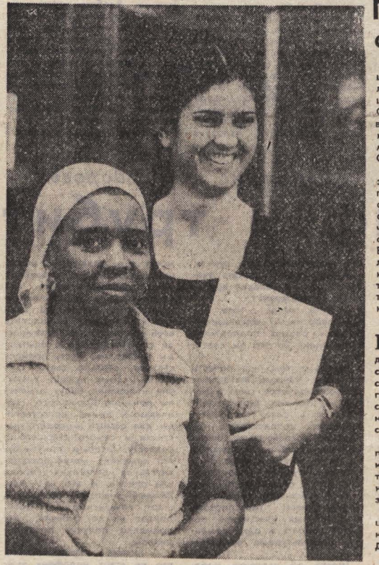
Вы с ними знакомы

▲ НЬЮ-ОРК. На карте, помещенной журналом «Ю. С. Ньюс» вид уряд рипорт, весь Карибский бассейн, уступая значительным обособленным местам дислоцирования американских вооруженных сил в центральном американских государствах. «Резкое увеличение численности размещенных в южноамериканских вооруженных силах в минувшем 1982 году свидетельствует о важности стратегии США», — пишет журнал. Это в полной мере относится и к Центральной Америке. ▲ ТОКИО. Крупное «военно-морское сражение» разразилось у берегов Южной Кореи, где с начала февраля проходят маневры «Тем спирит-83» с участием вооруженных сил США и сеульского режима. Самолеты южнокорейских ВМС вместе с кораблями американского 7-го флота ведут учебные «бои» с подводными торпедными катерками и истребителями «терпянка». Одновременно перебросились в Тавайских островов 25-я военная дивизия США начала учения в районе демилитаризованной зоны, отделяющей Южную Корею от КНДР. ▲ ТОКИО. Япония не только предоставляет США разработать новую ее современную военную технологию, но и согласна также поставлять за океан оружие собственного производства. Об этом заявил в парламенте директор американского департамента министерства иностранных дел Японии Х. Китакура.