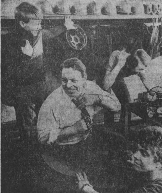
НА СНИМКАХ: самые лучшие минуты для педагога-наставника, когда он вместе с ребятами.