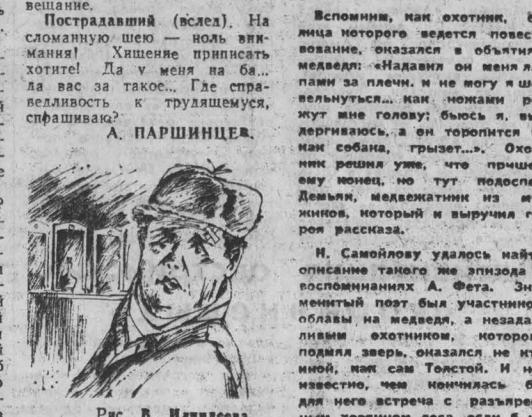
Рис. В. Липинцева.

Судья. Чем передаленный? Пострадавший. Чем? Чем? Гривидной! Ее передала через рез забор в тот самый момент, когда я... Я бы назвал это умилительным членораздельством. За причиненный ущерб — быть сырым мясом по голове — это же самый настоящий моральный ущерб — требую самого сурового наказания этих, с маскобината. Пусть в следующий раз