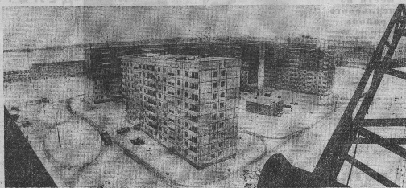
НА СНИМКЕ: растет Шалготарьян — новый микрорайон областного центра.