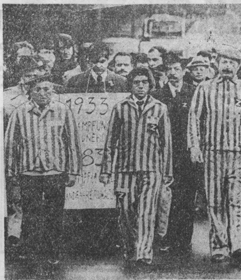
«Фашизм не должен повториться!». «Нет — войне!». «Нет — ядерным ракетам!» — под этими лозунгами состоялись массовые антивоенные манифестации и митинги во многих городах ФРГ.

Особенно глубокую тревогу, указывает она, вызывает размещение Пентагона в этом районе мира современных средств массового уничтожения.