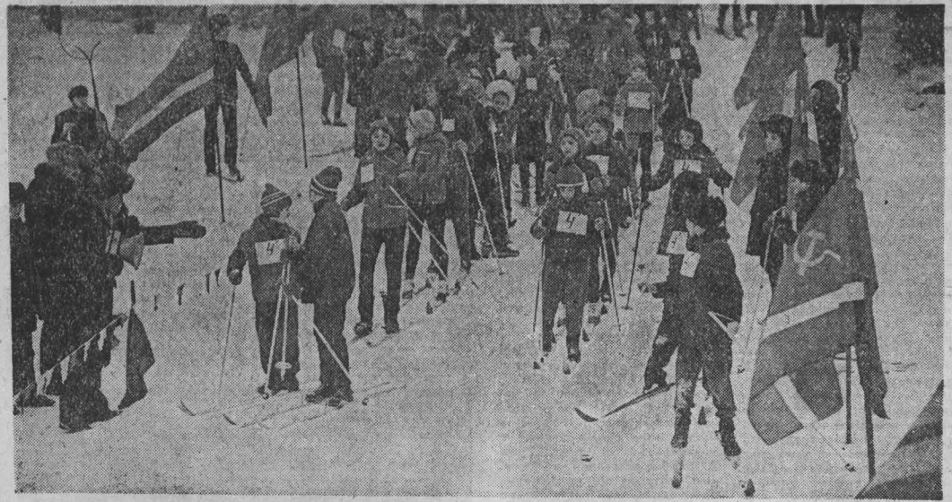
СТАЛО уже традицией в средней школе № 4 областного центра проводить дни здоровья. Вот и в прошедшие выходные дни более 500 учащихся этой школы вышли на лыжню. Победителей не было, только победители. НА СНИМКЕ: стартуют школьники. г. Кемерово.