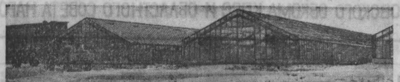
В совхозе «Тепличный» триста соток введено в эксплуатацию. На фото — теплица в совхозе «Тепличный».

дольше время. Теперь такие руководители оправдываются: «Исполкомы долго тянули с отводом земель». В связи с этим заместитель председателя облис-