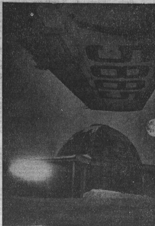
В парке им. Ю. Гагарина (г. Новокузнецк).