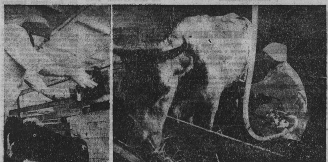
ЦЕХОМ номер один считается на Беловском ордена Трудового Красного Знамени автотранспортном предприятии сельское подсобное хозяйство. С начала его организации рабочие на фермах для здоровья производят, кормящие матери и мускулистые в диетическом питании получили 70 тонн молока. Сейчас в автомашине 12 дойные коровы, двадцать голов молодняка и 13 теленок. Удой этого года составил более 50 тонн молока.