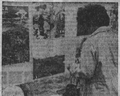
«Не допустим повторения Хиросимы и Нагасаки» — под таким лозунгом в одном из токийских парков экспонировалась фотовыставка, организованная Всесоюзным советом борьбы за запрещение атомной и водородной бомбы. Много численные снимки, представленные в экспозиции, рассказывают посетителям о трагедии двух японских городов, подвергшихся авиационной бомбардировке. По инициативе организаторов, главная цель фотовыставки — напомнить людям об опасности, которую несет миру империализм, еще теснее сплести ряды антигенов антивоинного движения. НА СИМИКЕ у стендов фотовыставки в Токио.

ЛОНДОН. В нарушение конвенции о запрещении разработки, производства, накопления запасов бактериологического (биологического) и токсинного оружия и уничтожении консервативного правительства Великобритании изучает возможность возобновления производства варварских средств ведения войны. Как сообщает лондонская газета «Санди таймс», хотя решения на этот счет пока не принято, персонал оперативности Великобритании, выходящих из конвенции, считается в кругах Уайтхолла вопросом первостепенной важности. Газета отмечает далее, что Англия, подписавшая между народами Конвенцию более десяти лет назад, тем не менее все это время не прекращала исследований, связанных с созданием бактериологического и токсинного оружия. Как заявила газета представительница министерства обороны Великобритании, соответствующие эксперименты проводятся в секретной лаборатории военного ведомства в Портон-Дауне.