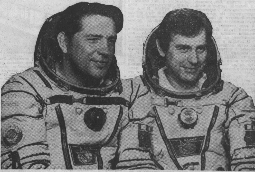
Экипаж космического корабля «Союз Т-9» — командир корабля летчик-космонавт СССР, Герой Советского Союза Владимир Афанасьевич Ляхов (слева) и бортинженер Александр Павлович Павлович.

В НОМЕРЕ Новое достижение советской космонавтики. 1 стр. Вуз: идеологическое воспитание молодежи. 2 стр. Репортаж из Ногордской области. 3 стр. Вторая победа хоккеистов «Кузбасса». 4 стр.