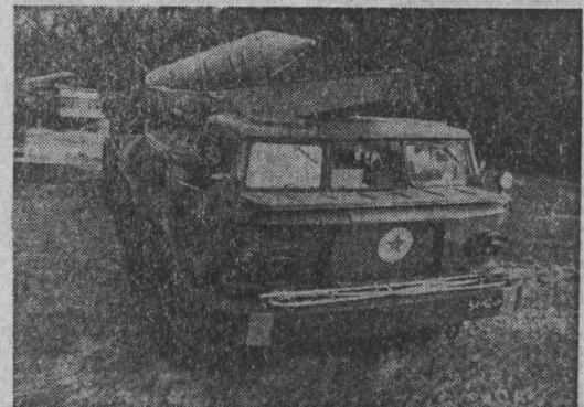
НА СНИМКЕ: ракетчики стоят на страже создательного труда.

Ежегодно 19 ноября в нашей стране торжественно отмечается всенародный праздник — День ракетных войск и артиллерии. В этот день советские люди славят немеркнущие подвиги фронтовиков — ветеранов Великой Отечественной войны, а также достойных преемников их боевой славы — воинов Советских Вооруженных Сил, воздают должное замечательным советским ученым и конструкторам, инженерам и техникам, рабочим оборонной промышленности — создателям могучего ракетного и артиллерийского вооружения. Продолжая боевые традиции своих отцов, ракетчики и артиллеристы зорко стоят на страже завоеваний социализма. В последнее время, учитывая чрезвычайно сложную военно-политическую обстановку в мире, нарастающую правящими кругами США, ракетчики и артиллеристы, как и все воины Советских Вооруженных Сил, бдительно следят за продвижением империалистов, настойчиво трудятся над повышением боевой готовности войск. Ракетчики и артиллеристы глубоко сознают всю полноту ответственности за обеспечение мира, за надежную защиту нашей Родины и с честью выполняют свой воинский долг, демонстрируя высокие морально-политические и боевые качества и монолитную сплоченность вокруг Центрального Комитета нашей Коммунистической партии. В едином боевом строю с воинами Вооруженных Сил СССР, армий братских стран Варшавско-