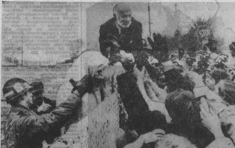
США. Американские сторонники мира, выступающие против размещения ядерных ракет в Западной Европе, проводят в 200 городах страны массовую антиядерную манифестацию.

Минувшая неделя проходила во всем мире под знаком празднования 66-й годовщины Великой Октябрьской социалистической революции, которое вылилось в новую яркую демонстрацию огромного международного авторитета Страны Советов.