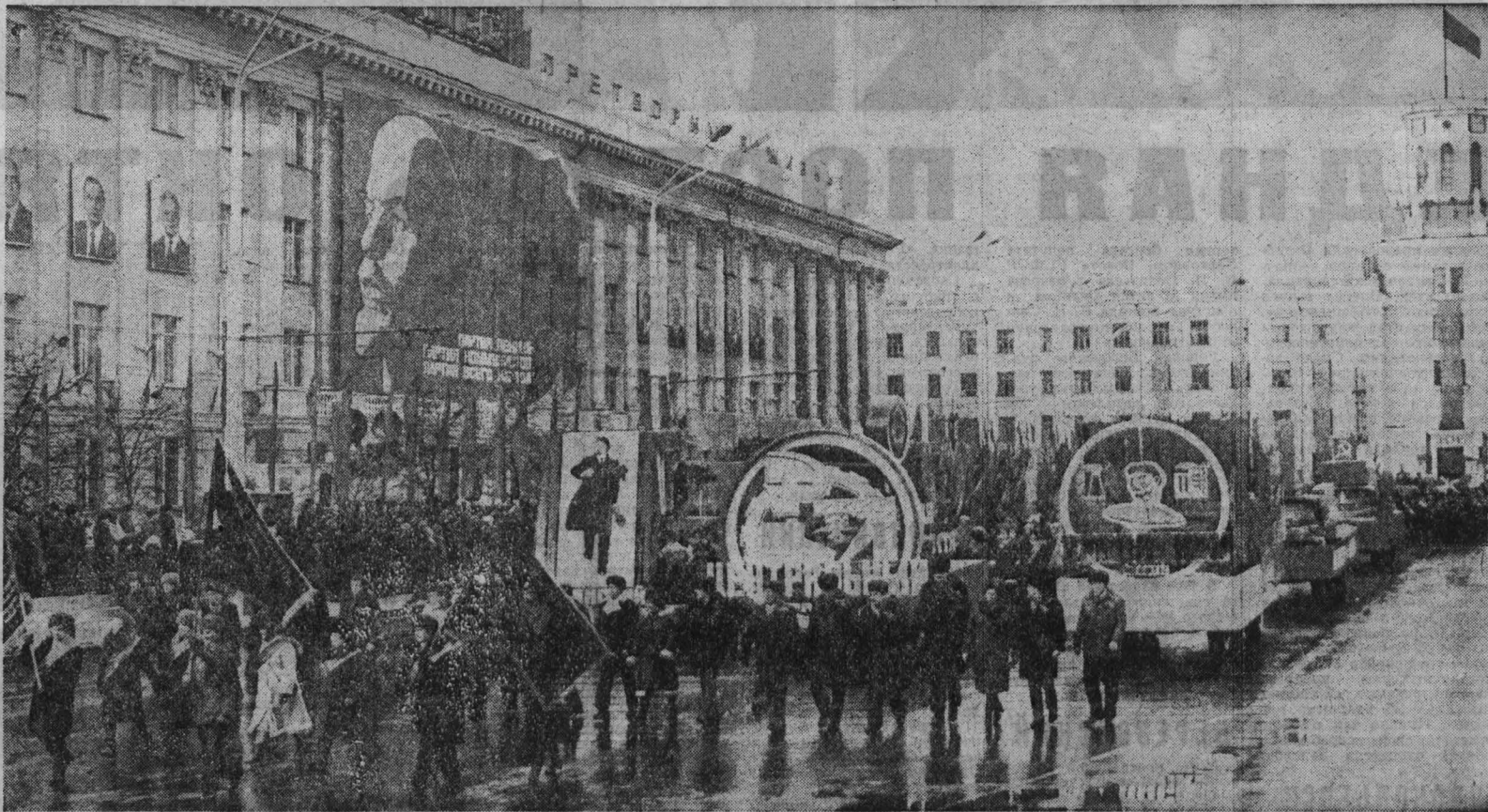
КЕМЕРОВО. Площадь Советов. 7 ноября 1983 года. Праздничная демонстрация трудящихся.

Закончив объезд войск, Д. Ф. Устинов поднимается на трибуну Мавзолея и провозглашает речь.