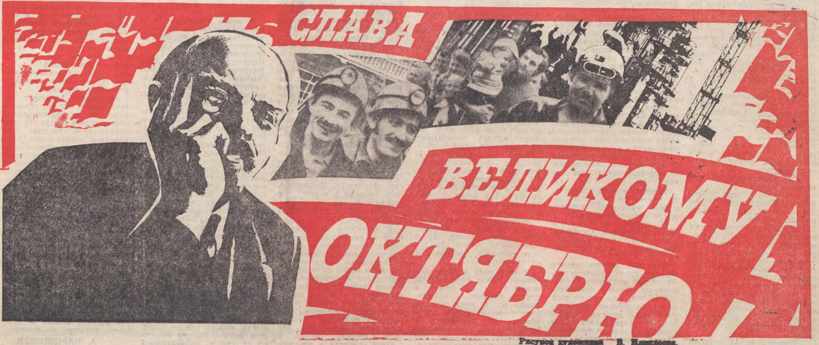
Рисует художник В. Игнатова

Под знаменем Ленина, под руководством Коммунистической партии — вперед, к победе коммунизма!