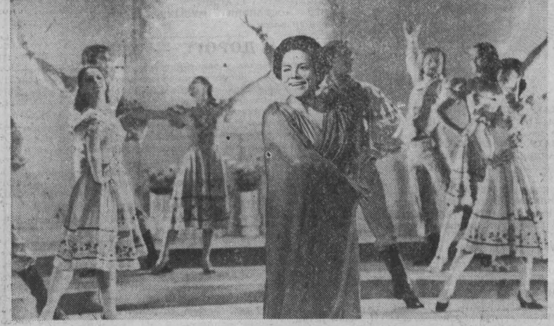
МОСКВА. Центральное телевидение страны готовит для зрителей традиционную передачу «Голубой огонек»...