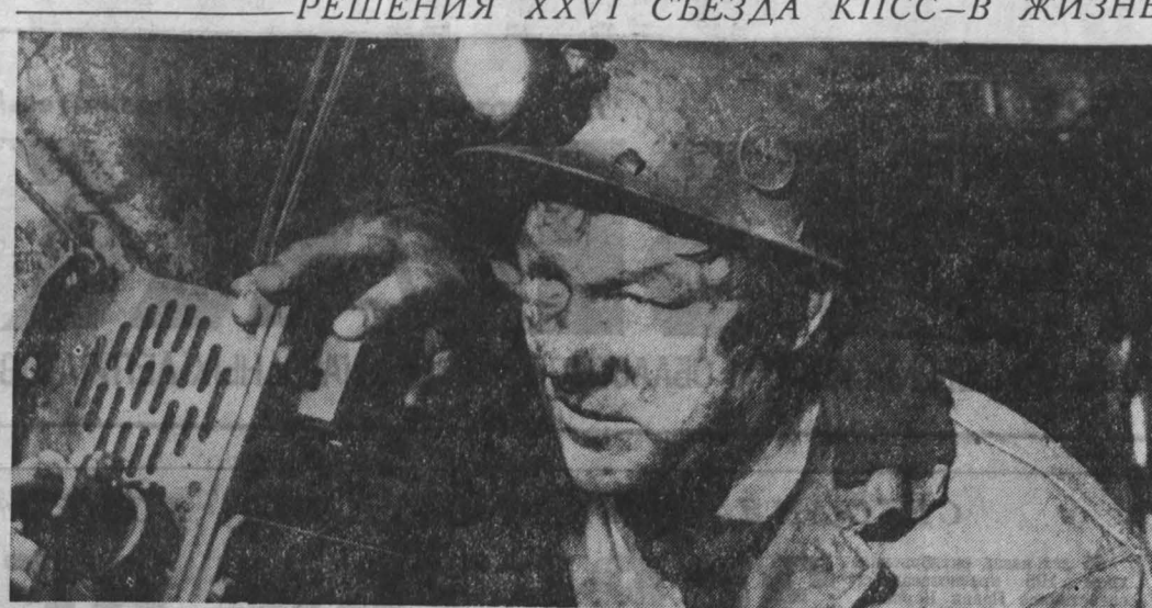
РЕШЕНИЯ XXVI СЪЕЗДА КПСС — В ЖИЗНЬ!