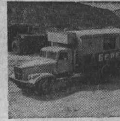
В целях экономии рабочего времени для трудящихся разреза «Черниговский» организованы горячие обеды, которые доставляет на рабочие места передвижная столовая «Березка».

На СНИМКЕ: «Березка» на одном из участков разреза «Черниговский».