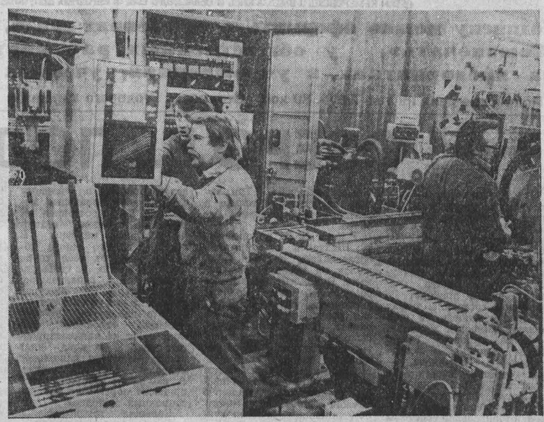
Многие годы поставляет свою продукцию в Советский Союз «Минроз» — действующее предприятие станкостроительной промышленности ГДР.

Сегодня важнейший фактор обеспечения эффективности усилий ООН по сдерживанию гоним ядерных вооружений — мирный шаг — направление курса Советского Союза, который выдвинул развернутую программу конкретных действий по устранению ядерной угрозы. С трибуны международного сообщества было впервые провозглашено обязательство не применять ядерное оружие первым, которое в одностороннем порядке приняла Организация Объединенных Наций.