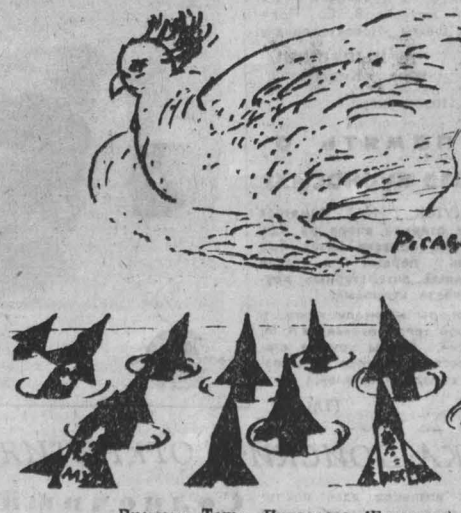
Рисунок Теньо Пиндарева (Болгария).

Генерал Мехия, придя к власти в Гватемале в результате государственного переворота, первым делом заявил, что «будет защищать права человека». Какое преступное изречение слов! Ведь этот человек известен всему миру как «важный» участник правительственной комиссии в США, которая расследовала убийства в Гватемале. О том, что часто одним и тем же словом придается разный смысл, много говорили на Пражской ассамблее