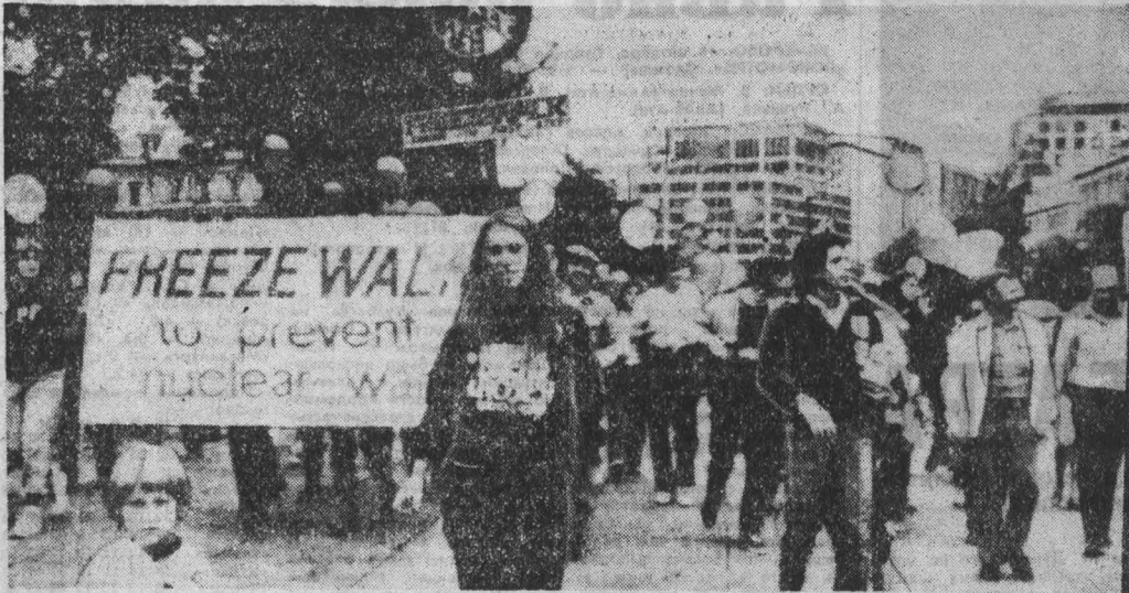
ВАШИНГТОН. «Обеспечьте мир» — под таким лозунгом в столице США состоялся 10-километровый марш, участники которого потребовали немедленного прекращения арсеналов ядерных вооружений, предотвращения угрозы новой мировой войны.