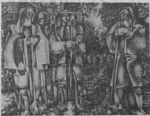
скульптур, графических листов.

областным комитетом партии много делается для укрепления материальной базы организации. В настоящее