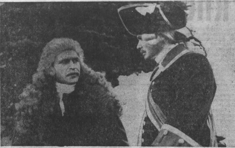
Наш кино клуб