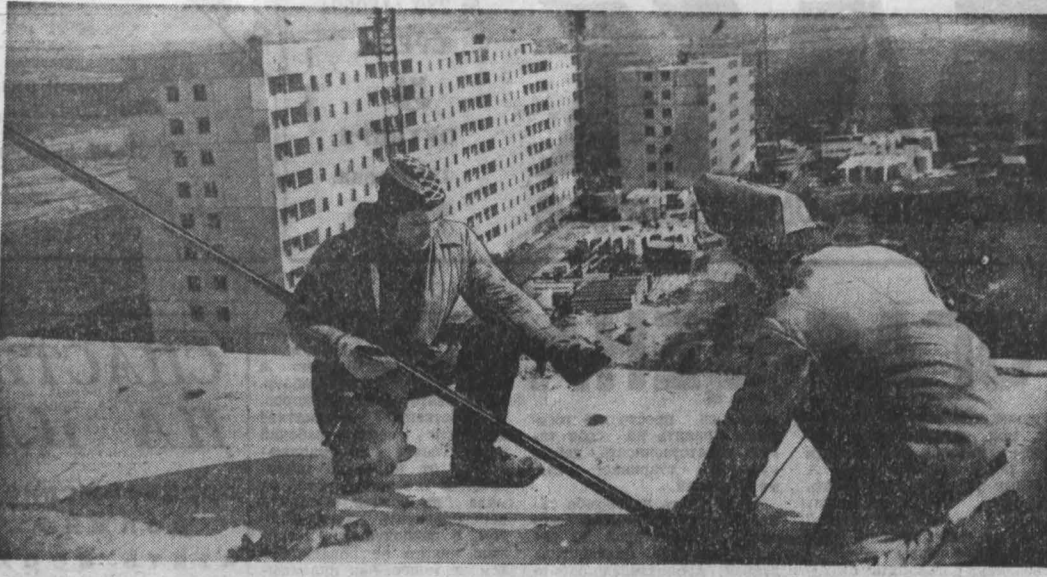
РАССТЕТ и благоустраивается Новоильинский микрорайон Заводского района города Новокузнецка. Сегодня в микрорайоне уже свыше 21 тысячи жителей. В этой пятитысячней здесь будут построены две школы, АТС на 200 номеров, трамвайная линия и ряд других сооружений. На СНИИМ: микрорайон строится.

Однако с третьей декады сентября выпуск дополнительного металла сократился: остановлен на капитальный ремонт литейный конвертер. На это по министерскому графику отведено 15 суток. Труженики цеха решили ускорить ремонт сталеплавильного агрегата на 24 часа. Ход выполнения обязательных ежесуточных контрольных партийно-хозяйственных штабов.