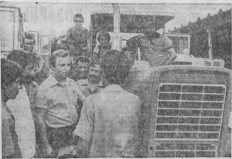
Советский Союз оказывает содействие Никарагуа в развитии сельского хозяйства. На полях республики успешно работают советские тракторы. Советские специалисты помогают в обслуживании, ремонте сельскохозяйственной техники, передают навыки...