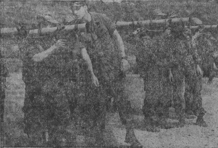
С ТЕРРИТОРИИ Гондураса в Никарагуа зачисляются банды сомосовцев, вооруженные американским оружием и обученные инструкторами из Пангоны. Помимо сомосовских банд, в агрессивных акциях принимает...