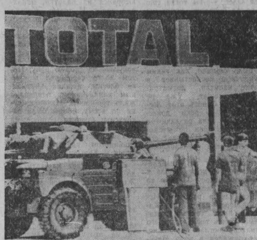
Франция продолжает наращивать масштабы вооруженной интервенции в Чад...