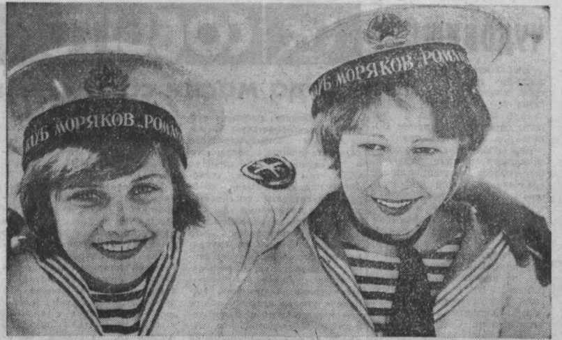
ЮНЫЕ МОЛЯКИ. (Весело и интересно провели свои летние каникулы ребята из клуба юных моряков «Романтик»).