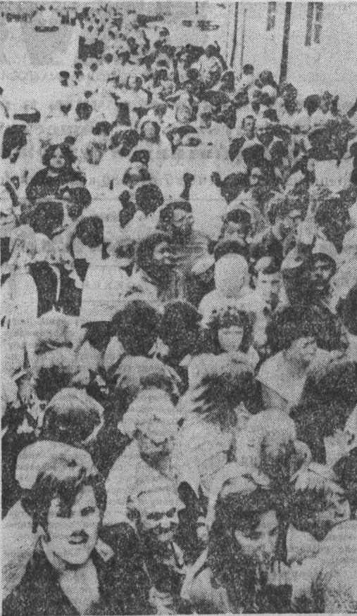
НАЦИОНАЛЬНАЯ проблемой в США стало стремительное увеличение числа голодающих американцев.