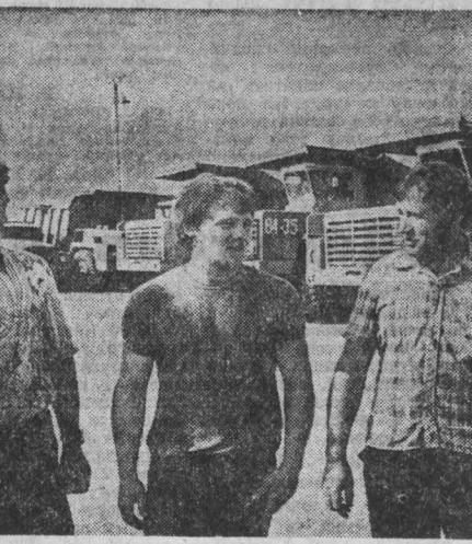
Ритмично работает сегодня Топкинский цементный завод. В нынешнем пятилетке его коллектив решил вырабатать около 13 миллионов тонн цемента.