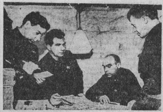
Генерал армии П. И. Батов (в центре) рассказывает о завершающем этапе битвы на Волге.

В наших войсках в те дни парило страстное желание пробиться к берегу Волги. «Выйти к Волге» — эти слова мы высказывали главным, что было на душе и у генерала, и у солдата.