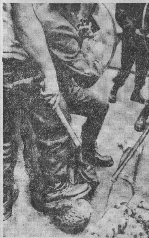
На снимке из журнала «Штерн»: полицейская расправа с участниками антивоенной манифестации в ФРГ.

Он бесцеремонно заявил, что «Соединенные Штаты вмешиваются в события в Ливане и что администрация будет и впредь поддерживать многонациональные силы и американские морские пехотинцы, входящих в состав этих сил». Американские войска, направленные в Ливан под фальшивым предлогом обеспечения безопасности и «поддержания мира» в стране, разразили боевые действия, которые привели к многочисленным человеческим жертвам. Шульц упорно отрицал наличие у Вашингтона планов увеличения американского военного контингента в Ливане, который уже в настоящее время насчитывает 1200 военнослужащих. Однако Пентагон планирует увеличить их численность еще на тысячу человек. К ливанским берегам станут американская военно-морская армия. В Белом доме третий день подряд продолжается заседание группы по урегулированию кризисных ситуаций под председательством вице-президента США Дж. Буша, на котором обсуждаются положения в Ливане.