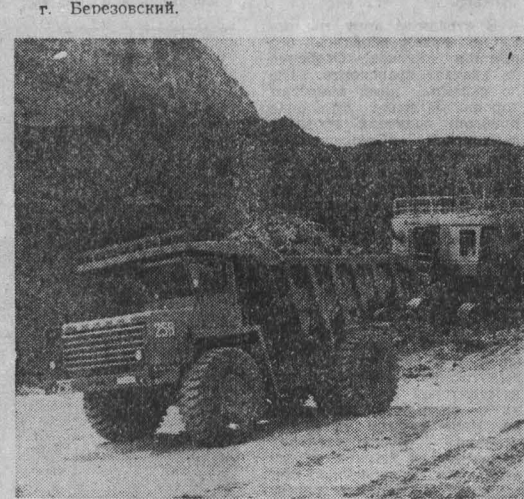
А. Цыряпкин, корр. «Кузбасса».