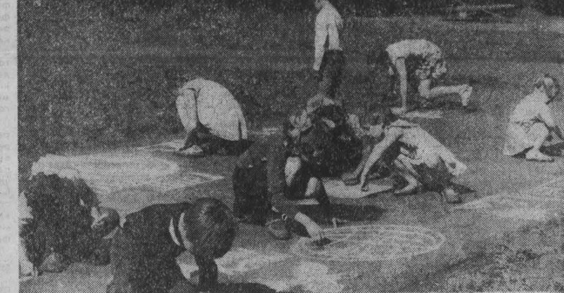
Последний анкорд школьного лета. В пионерском лагере «Лесная сказка» прошел конкурс рисунков на асфальте. Бюжета детская фантазия. Каждый из участников конкурса по-своему отразил свою мечту о мире.