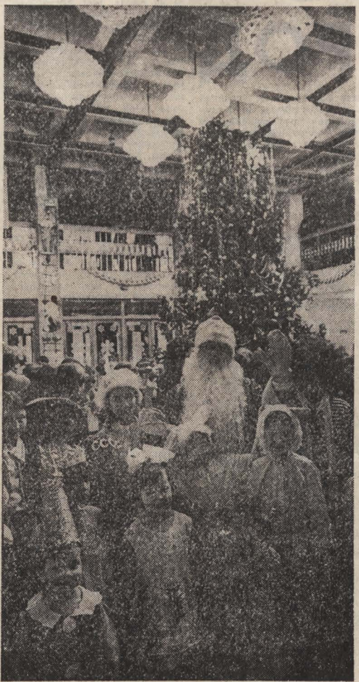
НА СНИМКЕ: веселый новогодний праздник.