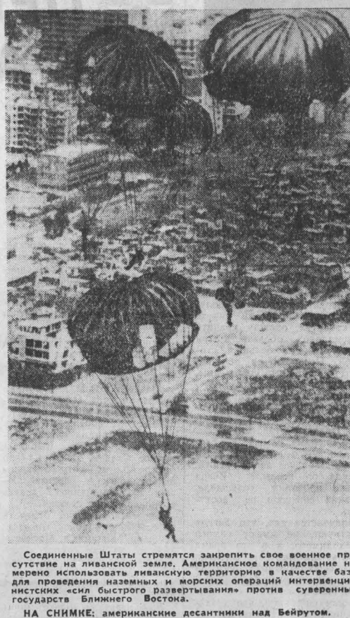
Соединенные Штаты стремятся закрепить свое военное присутствие на ливанской земле. Американское командование намерено использовать ливанскую территорию в качестве базы для проведения наземных и морских операций интервенционистских сил быстрого развертывания против суверенных государств Ближнего Востока.

Во время пребывания в Принстоне участники «Велопробега мира-83» встречались со студентами и преподавателями Принстонского университета, общественностью города, выступили в программе местной радиостанции.