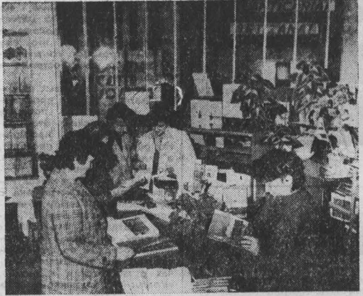
СРР. С большим успехом у жителей и гостей Бухареста прошла выставка советской книги...