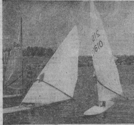
Виндсерфинг — один из самых молодых видов спорта у нас в области. Особую популярность он завоевал у спортсменов Белова.

Паутина расстилается по растениям — к теплу и ясной осени. Цветет иван-да-марья — полно грибов. Вода в реке пенится — к дождю.