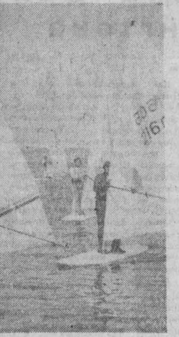
Путешествуйте! Приглашает дельта Волги