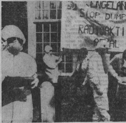
НА СНИМКЕ: представители голландской общественности во время выступления протеста перед зданием английского посольства в Гааге.

Бразильский золотодобытчик Хосе Рибамунду из Оливейры недавно обнаружил в районе Сьерра-Пелада на западе страны самородки общим весом около ста килограммов. Самородок весом 33,3 килограмма обнаружил в 23 километрах от Токно, полагаясь, что это золото. Вскоре были обнаружены самородки в других районах.