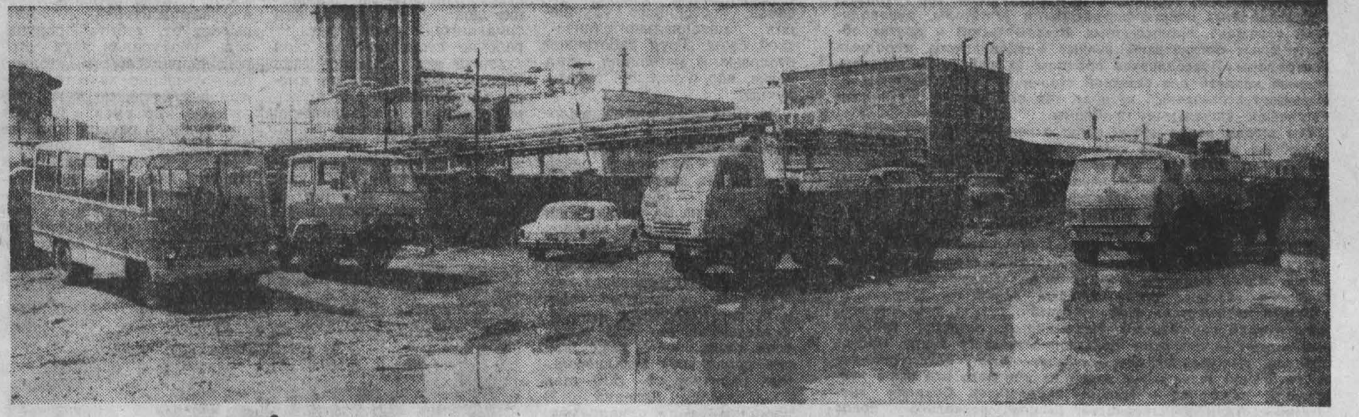
ЧАСАМИ простояют возле базы «Кузбассдизель» в ожидании груза из-за неоперативного оформления документов большегрузные машины из Прокопьевска, Новокузнецка, Кемерово и других городов области.