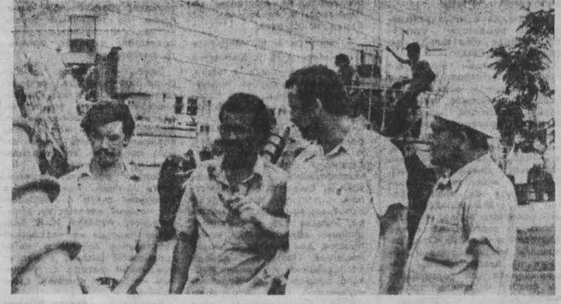
КУБА. Комбинат тростниковоуборочных комбайнов имени 60 годовщины Великой Октябрьской социалистической революции по праву считается символом советско-кубинской дружбы. Возвращенный шесть лет назад при техническом содействии Советского Союза, он превратился в одно из крупнейших предприятий машиностроения острова Свободы. Большую помощь кубинским рабочим оказывают советские специалисты и сейчас. Около половины кубинских кадровых рабочих, техников и инженеров прошли стажировку в СССР.

БЕИРУТ, 22. (ТАСС). Решение израильской администрации о выводе войск из Ливана встретило решительное осуждение ливанских политических и общественных кругов. Этот маневр Тель-Авива рассматривается здесь как попытка под видом окончательного отвода войск закрепить оккупацию Южного Ливана. Президент страны А. Жмайель, находящийся в Вашингтоне, заявил, что новый шаг