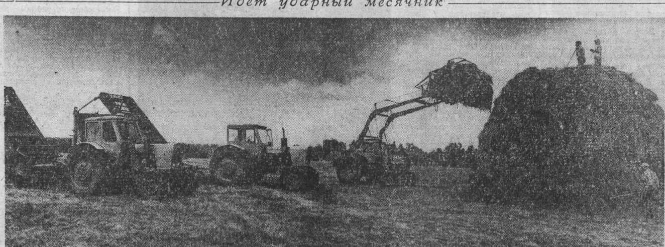
НА СНИМКЕ: заготовка сена в Юргинском районе.