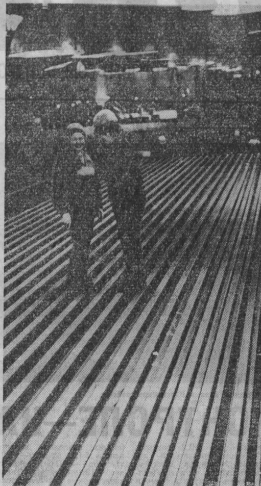
Очередная партия термопрочных рельсов подготовлена и отправлена на строительство Байкало-Амурской магистрали. В сотню адресов идет продукция рельсобалочного цеха Кузнецкого металлургического комбината. Особое внимание обращается на качество рельсов, которым предстоит нести службу в районах Крайнего Севера. Для этого их подвергают специальной обработке. На снимке: в отделении рельсоотделки Кузнецкого комбината.