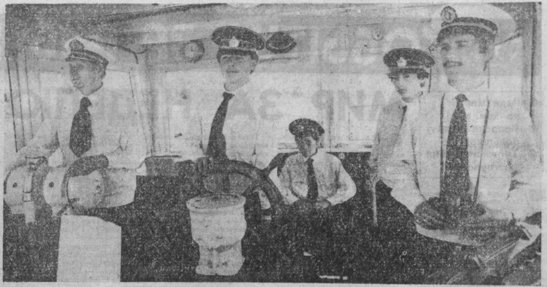
НА СНИМКАХ: юные моряки клуба «Романтика» в походе.