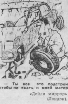
— Ты все это подстроил, чтобы не ехать к моей матери. «Девки миррор» (Лондон).