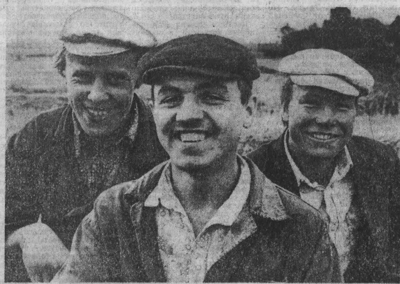
132 тонны сена поставили в стога в день всенуждосского субботника по заготовке кормов механизаторы совхоза «Ельнинский»...