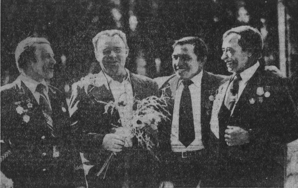
Горняцкий стаж — 100 лет