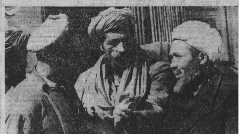
А ПРЕЛЬСНАЯ революция 1978 года открыла перед Африканским континентом дорогу обновления. За эти годы сделано немало. Предпринимаются усилия для проведения земельно-водной реформы, подъема промышленного и сельскохозяйственного производства, развития народного просвещения, культуры, здравоохранения, для обеспечения равенства женщин, полного равноправия всех национальностей и племен.

1898 г. Великобритания приобрела в аренду сроком на 99 лет еще одну часть полуострова Цзялуан, прилегающую островам, получившую название «новые территории».