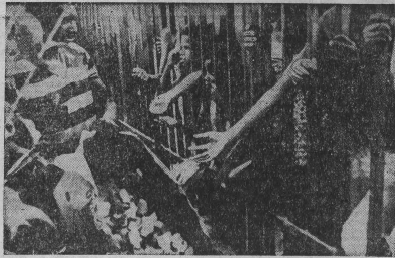
БРАЗИЛИЯ. Около 80 человек погибли во время сильных наводнений в административном центре штата Минас-Жерайс городе Белу-Оризонти. Три тысячи человек остались без крова. Вода уничтожила большие запасы продовольствия в городе. Вышедшая из берегов в результате ливней река Арудас продолжает угрожать густонаселенным кварталам Белу-Оризонти. Правительство принимает меры по оказанию помощи пострадавшим от стихии. НА СНИМКЕ: раздача хлеба оставшимся без крова в результате стихийного бедствия.

АММАН, 18. (ТАСС). Уровень инфляции в Израиле в 1982 году достиг рекордной цифры за всю историю этой страны — 131,5 процента. Это на 30 процентов превышает показатель 1981 года, сообщила центральное статистическое бюро Израиля. Только в декабре минувшего года стоимость жизни возросла здесь на 5,5 процента. На днях в Израиле был обнародован государственный бюджет на 1983 год. Как явствует из этого документа, 38 процентов бюджетных ассигнований предназначено на погашение огромного внешнего долга, 24 процента — на военные расходы.