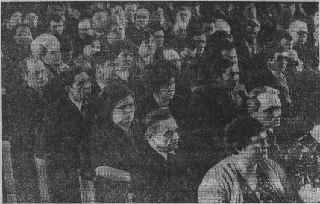
Собрание актива партийных, советских, профсоюзных, комсомольских и хозяйственных организаций в Кузбассе.

Многопредставительная проблема обеспечения трудовыми ресурсами не она сжимает. В значительной мере, говорит оратор, это зависит от дальнейшего развития бригадных форм организации и совершенствования труда, от дальнейшего хорошего налаживания социалистического соревнования. Число бригад за два года увеличилось на 110, в них сейчас входит 61 процент рабочих. За этот период в лухтах бригадах не допустили ни одного на-