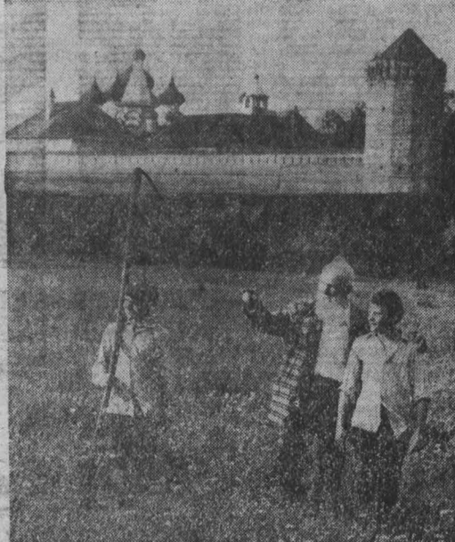
ЖЕМЧУЖИНЫ ДРЕВНЕЙ КУЛЬТУРЫ

Похититель не испугался, а, напротив, стал жалеть, когда приблизился к хозяину. — Не кипятитесь! — сказал