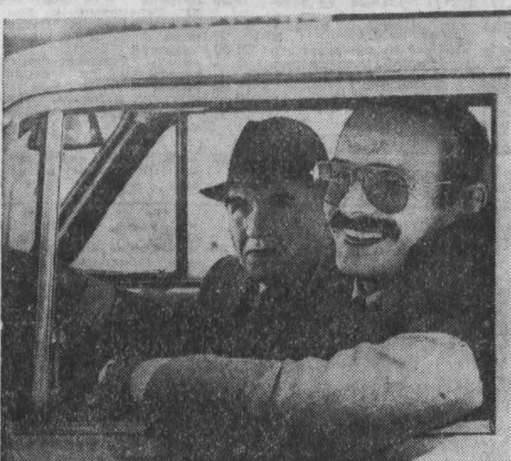
НА СНИМКЕ: кадр из кинофильма «Инспектор ГАИ».