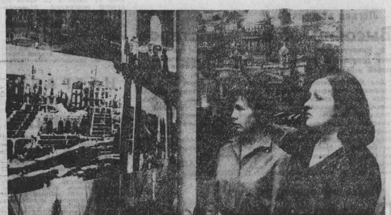
ПРАГА. В Доме советской науки и культуры открылась фотовыставка ТАСС «Подвиг во имя мира». Представленные на ней работы военных фоторепондентов ТАСС рассказывают о Сталинградской, Курской битвах и других стратегических операциях, проведенных Красной Армией в 1943 году, о прорыве блокады Ленинграда. Фотодокументы запечатлели героизм советских воинов.

БОНН, 7. (ТАСС). Пресс-бюллетень СДПГ «Парламентарии-политики» помещил статью с анализом внешнеполитического курса правящей коалиции ХДС/ХСС и СДПГ, в которой, в частности, говорится: итоги первых стадий позволяют сделать вывод о том, что за спорами о текущей политике, которые ведет правительство, нельзя не заметить смену внешнеполитического курса, затмевающей собой все остальное и означающей отказ от преемственности, о которой так много говорят. Эти перемены совершаются постепенно, как плавный процесс, по возможности без лишнего шума и без резких изменений. Важные изменения курса внешней политики следуют из консервативных концепций, а также той новой роли, которую правящая коалиция придает ФРГ в осуществлении своей политики в области безопасности.