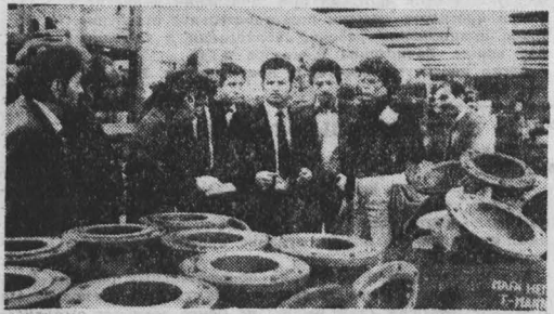
ГДР. Этот снимок сделан в цехе арматурного завода в Прендау во время посещения его группой советских туристов. Как и многие другие промышленные предприятия республиканского завода принимает деятельное участие в осуществлении программы экономического сотрудничества с Советским Союзом. Изготовленное здесь оборудование используется, в частности, на строительстве газопровода Угренгой-Унгероград. В текущем году отсюда в СССР будет отправлено двенадцать процентов объема готовой продукции.

БЕЗУСОН-АПРЕС. В Чили создались условия для достижения соглашения между всеми оппозиционными силами, заявили руководители коалиции страны на встрече с группой журналистов, состоявшейся в глубоком подполье в Сантьяго. Об этом свидетельствуют нарастающие борьбы народа против фашистской диктатуры, его требования к власти за восстановление демократии и изменение режима, в нынешней обстановке, подчеркивалось на встрече, необходимо решительно выступить за восстановление демократии и изменение режима, в котором палачи бы представляли все без исключения оппозиционные круги. Руководители коалиции указали вместе с тем, что до сих пор еще не полностью преодолены препятствия на пути достижения полного единства в рядах оппозиции. Еще не определенная своя позиция вооруженные силы, они не готовы на себя обязательство выступать за возвращение к демократии.