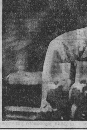
ПРОДУКЦИЯ Кузнецкой фабрики игрушки известна далеко за пределами Кузбасса. А знаменитые резные сибирские медведи не раз отправлялись из Кузбасса в Европу, Америку, Японию.

В совхозе нет ни гаража, ни даже примитивных мастерских. А люди едут! Идут в общежития, на частные квартиры. Но это, кажется, не отражается на их работе.