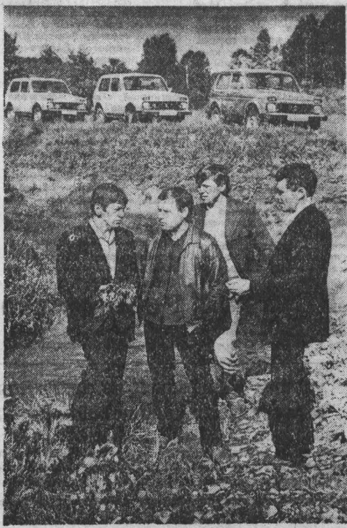
НА ДВА миллиона рублей ежегодно закупают у населения различного сырья и продуктов питания работники заготовиторов Кемеровского райпотребсоюза...