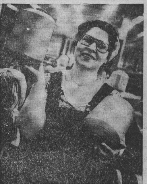
РАДОСТЬ ТРУДА. Передовая ткачиха-много-станочница комбината шелковых тканей имени Рудакова.