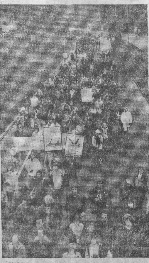
УЛИЦА СТОКГОЛЬМА. УЧАСТНИКИ ДЕМОНСТРАЦИИ ЗА МИР НА ОДНОЙ ИЗ УЛИЦ СТОКГОЛЬМА.