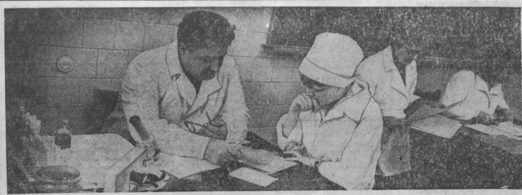
«Тяжелый экзамен!» — этот требовательный плакат сейчас увидишь на многих дверях институтских аудиторий. Да, сессия в разгаре. Она втягивает в свою орбиту все новые группы и факультеты.