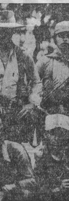
ПРОДОЛЖАЯ успешные боевые действия, сальвадорские патриоты удерживают и контролируют обширную территорию страны. Они наносят значительный урон карателям режима, захватывают оружие, которое используют против противника.

Дж. Бушу, сложившись довольно напряженные отношения с «калifornийским окружением» президента Рейгана. По имеющимся данным, после недавнего для администрации голосования в палате представителей по вопросу об ассигновках на ракету «MX» министр обороны К. Уайтбергер также подал заявление об отставке, но президент Р. Рейган ее не принял. Одновременно предполагается отставка заместителя министра обороны США Ф. Икля, поскольку Белый дом склонен возложить на него ответственность за возникновение разногласий между администрацией и конгрессом по вопросу размещения ракет «MX». Все недавно произведенные, а также намеченные перестановки американские политики и обозреватели связывают с растущими трудностями для правительства президента Р. Рейгана, с серьезнейшими проблемами как в области внешней, так и внутренней политики.