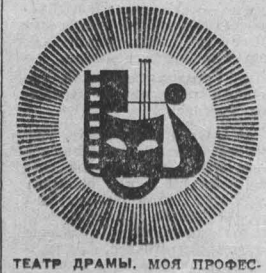
ТЕАТР ДРАМЫ. МОЯ ПРОФЕССИЯ — СИБИРЬ ИЗ ОБЩЕСТВА. Начало в 19 час.

ТЕБЯ МОЯ РОССИЯ (12.30). ВОЙНЫ АТЛАНТИДЫ (13.30). СМЕРТЬ СРЕДИ АПСБЕРГОВ (15.17.19). ДИ ШАХТЕРОВ. ЗВЕЗДОЧКА (14). ЛИЧНЫЕ СЧЕТЫ (16.18.30.20.30). ДК КОНСОХИМЗОВОДА. Кинесобрание мультфильмов КАК БУДТО (13.30). ТРОИХ НАДО УБРАТЬ (15.17.19) — летим смотреть не рекомендуется. КЛУБ ГРЭС. ПОВЕСТЬ О НАСТОЯЩЕМ ЧЕЛОВЕКЕ (13). РОДНИ (15.17.19). КЛУБ ВОГ. НА ЧУЖОМ ПРАЗДНИКЕ (17-е субтитрами). 17 ЯНВАРЯ ФИЛАРМОНИЯ. Малый зал. Лауреат международных конкурсов СТРУННЫЙ КВАРТЕТ. Начало в 19 час. ДОМ КИНО «МОСКВА». Большой зал. Новый цветной английский художественный фильм ЗЕРКАЛО ТРЕСНУЛО (10.12.14.16.18.19.50.21.40). Киновечер, посвященный творчеству АГАТЫ КРИСТИ (в 18 час.). Малый зал. Уточнительный фильм «УБИЙСТВО В ВОСТОЧНОМ ЭКСПРЕССЕ» (11.30.18.30). Художественный фильм БУДЬТЕ ГОТОВЫ, ВАШЕ ВЫСОЧЕСТВО! (10.14.40). Киновечерия ВОЛГА-ВОЛГА (12.40.16.30.19.30.21.20).