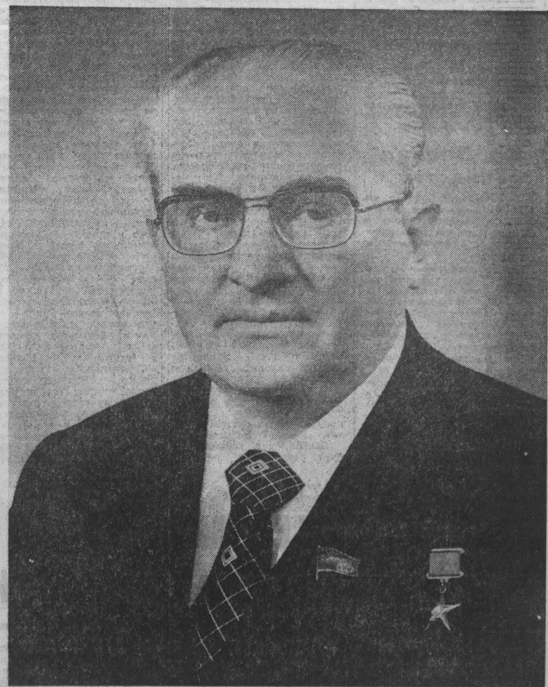
Постановление Верховного Совета СССР

С докладом «О международном положении и внешней политике Советского Союза» выступил первый заместитель Председателя Совета Министров СССР, министр иностранных дел СССР депутат А. А. Громыко.