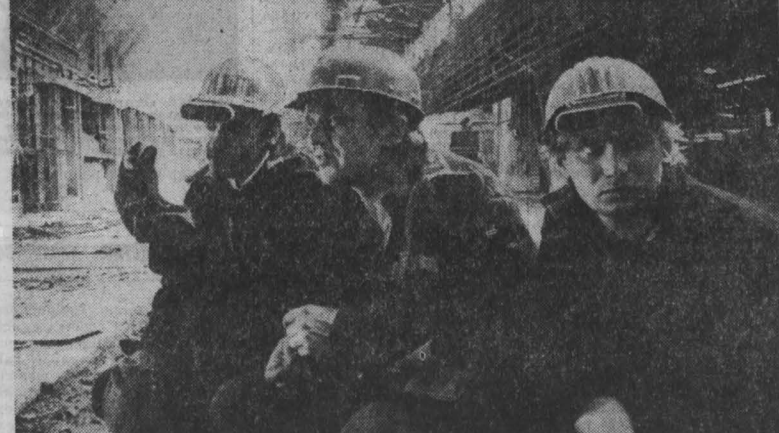
Проверяем выполнение обязательств