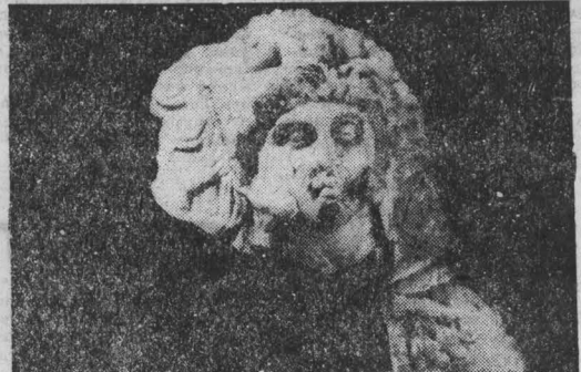
Из глубины веков. НА СНИМКЕ: портрет Александра Македонского, выполненный из слоновой кости, найден на городище Тахт-Салим. В Памятник геном античного искусства III вен до нашей эры).

«Мы жили», — говорится в книге, — по законам военного времени, работали по 12 часов в сутки без выходных дней. Руководители про-