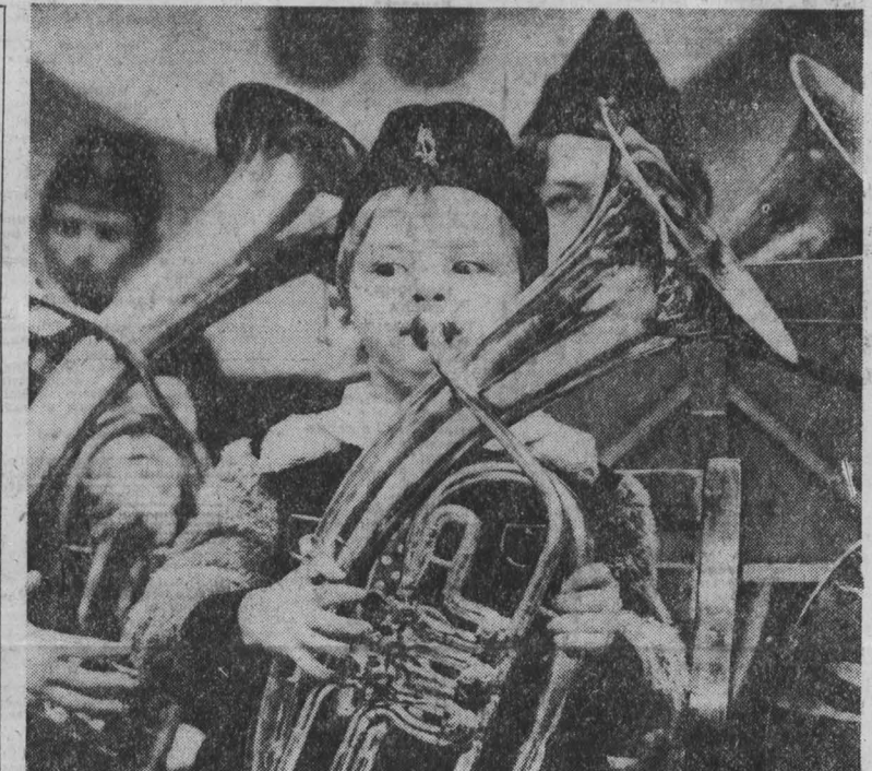
Марш юных.

Внедрение КС-УКР в объединении позволило повысить производительность труда, за 1982 год на 11,5 процента при ежегодном выпуске 700 наименований изделий, повысить удельный вес продукции высшей категории качества в объеме производства, возросла эффективность, возросла производительность и качество работы. Число (бригадно-клеточное) качество в 1982 году имели 1500 рабочих и 67 бригад.