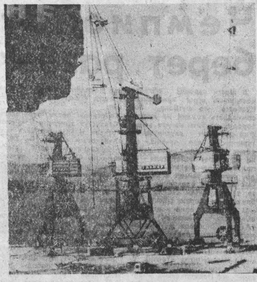
(ТАСС, 9 июня).