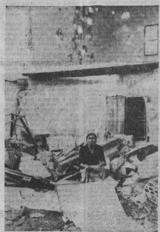
ЛИВАН. Проводит курс на физическое уничтожение арабов-палестинцев, где бы они ни находились, палачи-сионисты проводят чудовищные расправы над беззащитными женщинами, стариками, детьми на захваченных арабских территориях. Пополнившая длинный список международных преступлений Тель-Авива бойня в Сабре и Шатиле в сентябре прошлого года заставила сорогнуться миллионы людей на нашей планете.

Кое-что был бы не прочь, чтобы в той же мере, как Европа, для этих целей использовался и «пятый континент». Конечно, мы в Австралии не можем предотвратить создания потенциала первого ядерного удара. Но мы в силах поставить немало преград на пути американцев. Если бы удалось создать зону, свободную от ядерного оружия между Тихим и Индийским океанами, то это очень осложнило бы переброску, к примеру, американских войск в районе Ближнего Востока. Точно так же, если бы европейскому антиракетному движению удалось предотвратить размещение ракет, то это лишило бы американцев возможности угрожать эскалацией военных действий в третьем мире.