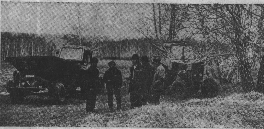
На осеннем поле