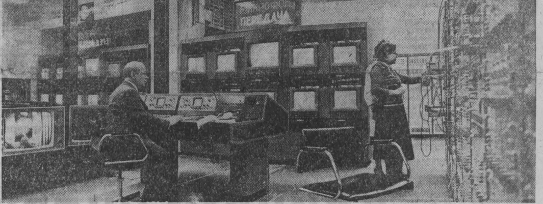
А НА КЕМЕРОВСКОЙ студии телевидения в начале этого года был сдан в эксплуатацию новый аппаратно-студийный блок. Новейшее советское оборудование, установленное здесь, — это третья по сложности ответственности цветной техники. Новая аппаратура позволяет работникам студии значительно улучшить качество цветного изображения.

Совещания по некоторым практическим вопросам развития сельского хозяйства районов состоялись в Ижморском, Прокопьевском, Чебулинском, Янском, Лысковском, Мариинском, Горномарском и Топкинском районах партии. Эти вопросы обсуждены на пленумах Тисульского и Ижморского райкомов КПСС.