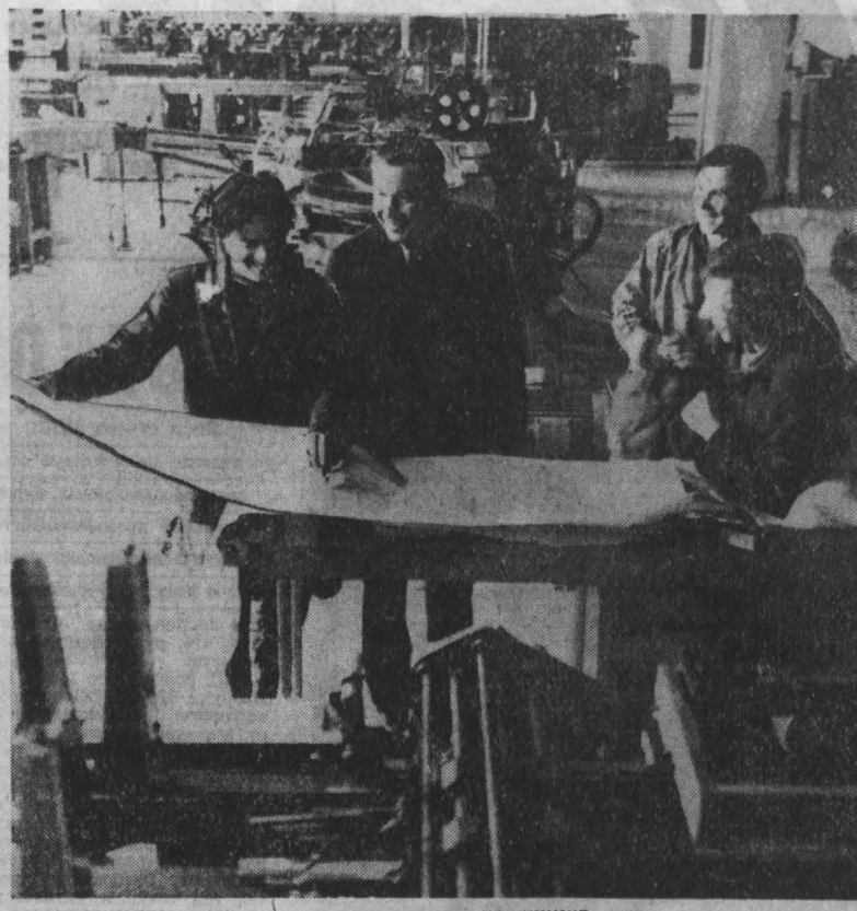
В издательстве «Кузбасс» заканчивается монтаж поточной автоматической линии по выпуску книг в твердом переплете. При двухсменной работе здесь будут выпускать шесть миллионов экземпляров книг в год.

По итогам Всесоюзного социалистического соревнования коллективов предприятий и организаций системы Государственного комитета СССР по телевидению и радиовещанию за первый квартал третьего года пятилетия коллективу Кемеровского радиотелецентра присуждено третье место с вручением денежной премии и Почетной грамоты Госкомитета СССР и ЦК профсоюза работников культуры.